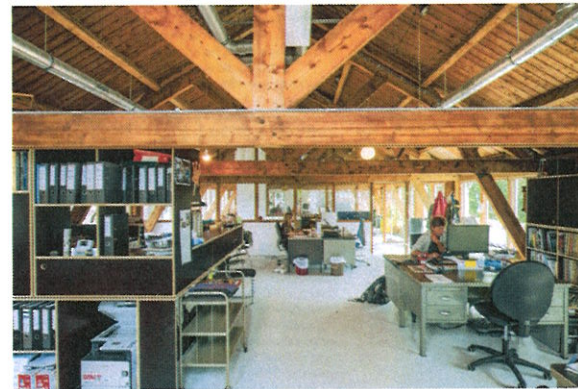
CATEGORIE: KANTOOR Het Seinwezen, Haarlem

Dit is een waanzinnig mooi vormgegeven zorginstelling. Vooral de relatie met de natuur is spectaculair. Het gebouw stimuleert om sneller te revalideren. Het pand is met aandacht voor natuurlijke materialen ontworpen, en het is mooi dat ook de buurt er een relatie mee heeft – dat brengt leven in de browserij. Als jury merken we op dat dit een relatief duur gebouw is, zowel om het te bouwen als in de exploitatiekosten. Maar wij willen een lans breken voor investeringen in leefbare gebouwen in de zorg. Die investeringen lonen, en kunnen er zelfs voor zorgen dat patiënten sneller genezen en herstellen. Nederland heeft een inhaalslag te maken als het gaat om leefbaarheid in de zorg. Andere landen zijn al veel verder met het ontwerpen van zogeheten healing environments waarin de ervaring van de patiënt voorop staat.