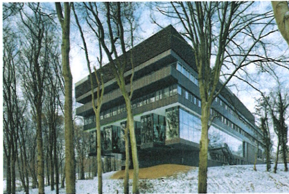
CATEGORIE: ZORG Hoofdgebouw van Revalidatie Medisch Centrum Groot Klimmendaal, Arnhem

3 De jury deed onderzoek naar de gebouwen op de shortlist , en wies uiteindelijk de bouwprojecten op de volgende pagina's aan als beste voorbeelden van leefbare omgevingen.