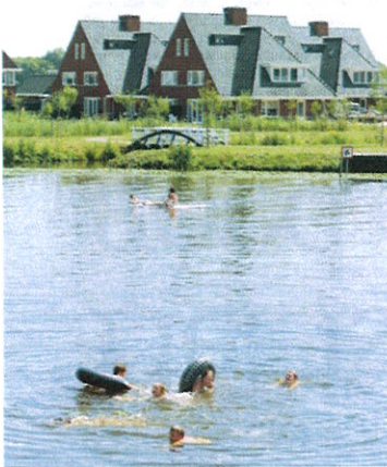
CATEGORIE: OVERHEID Gemeente Molenwaard

'We zijn erg gecharmeerd door het fenomeen kluswoning! Het staat voor leefbaarheid. Spangon dreigde om te vallen, en door de kluswoningen is er een herwaardering gekomen voor de woningen en de wijk. Het klushuis doet echt iets met de leefbaarheid van een wijk. Het is altijd mooi als mensen echt eigenaarschap nemen voor hun woning, en er met hart en liefde in investeren. Nederland heeft veel huurwoningen, en daar voelen mensen zich vaak minder verantwoordelijk voor. Kortom, de kluswoningen zorgen voor betrokkenheid bij de woonomgeving.'